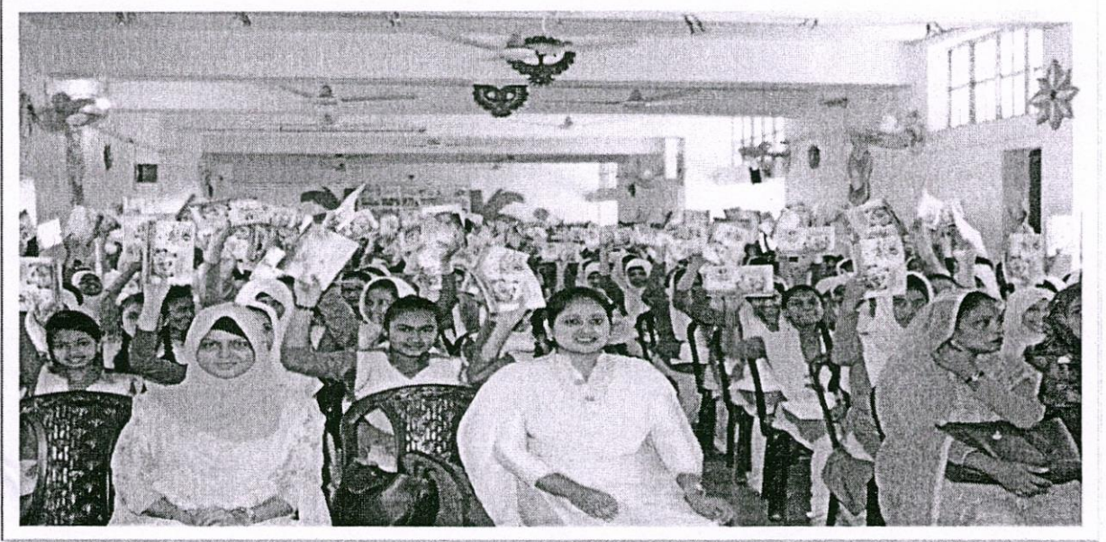
ছবিঃ সাভার ক্যান্টনমেন্ট বোর্ড হাইস্কুলে অনুষ্ঠিত “ডিজিটাল নিরাপত্তায় মেয়েদের সচেতনতা” শীর্ষক কর্মশালার চিত্র।