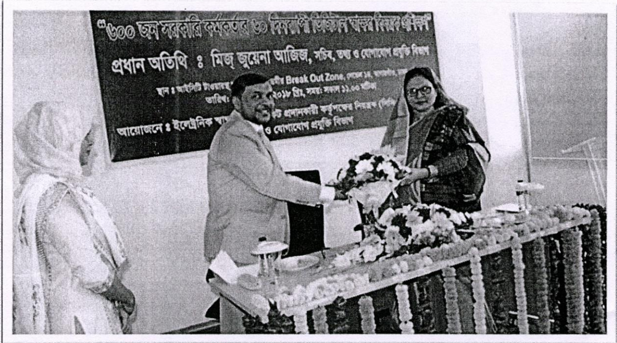
ছবিঃ ৬০০ জন সরকারী কর্মকর্তার ৬০ দিনব্যাপী ডিজিটাল স্বাক্ষর বিষয়ক কর্মশালার উদ্বোধনী অনুষ্ঠান।