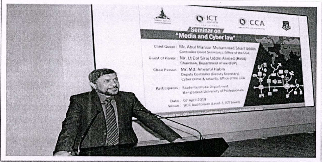
ছবি: “Media and Cyber Law” বিষয়ক সেমিনারে বক্তব্য রাখছেন নিয়ন্ত্রক সিসিএ মহোদয়, স্থানঃ বিসিসি অডিটোরিয়াম, আগারগাঁও, ঢাকা।